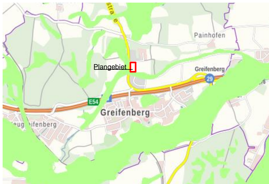
Abbildung 3: Luftbild mit wassersensiblen Bereichen (hellgrün dargestellt) entlang des Längenmoosgrabens und eigene Darstellung

Der Längenmoosgraben ist ein Gewässer 3. Ordnung und beginnt rund 500 m südwestlich als Entwässerungsgraben der dort vorhandenen, als Grünland genutzten, landwirtschaftlichen Flächen. Er verläuft dann direkt südlich des Plangebietes und mündet rund 2 km weiter östlich in die Windach.