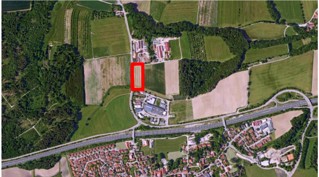
Abbildung 2: Plangebiet, ohne Maßstab, Quelle: Geobasisdaten© Bayerische Vermessungsverwaltung 2018, und eigene Bearbeitung

Das Gebiet der 10. Änderung liegt in der Gemeinde Greifenberg nördlich vom Hauptort Greifenberg und der Autobahn A 96. Es umfasst die Flurnummer 501, Gemarkung Greifenberg und weist eine Größe von ca. 1 ha auf.