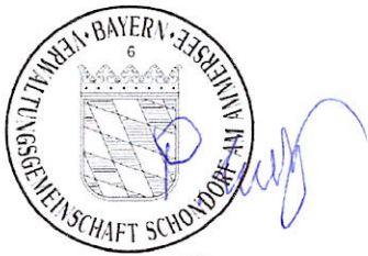
Müller 1. Bürgermeisterin

Die Verarbeitung personenbezogener Daten erfolgt auf der Grundlage der Art. 6 Abs. 1 Buchstabe ---e (DSGVO) i.V. mit § 3 BauGB und dem BayDSG. Sofern Sie Ihre Stellungnahme ohne Absenderangaben abgeben, erhalten Sie keine Mitteilung über das Ergebnis der Prüfung. Weitere Informationen entnehmen Sie bitte dem Formblatt „Datenschutzrechtliche Informationspflichten im Bauleitplanverfahren“ das ebenfalls öffentlich ausliegt.