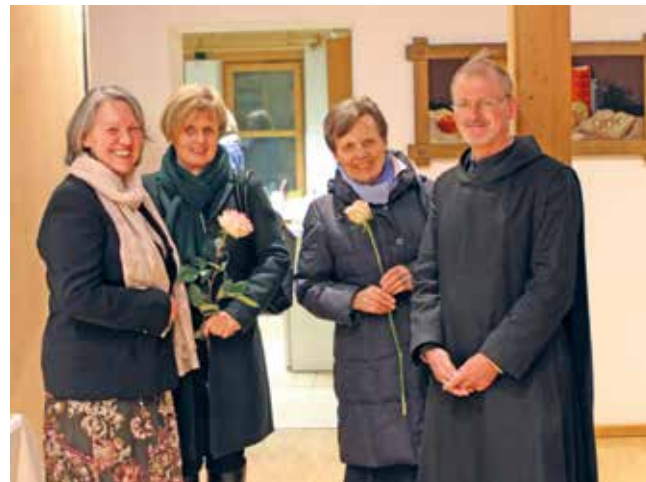
Bilder: Irmgard Schleich